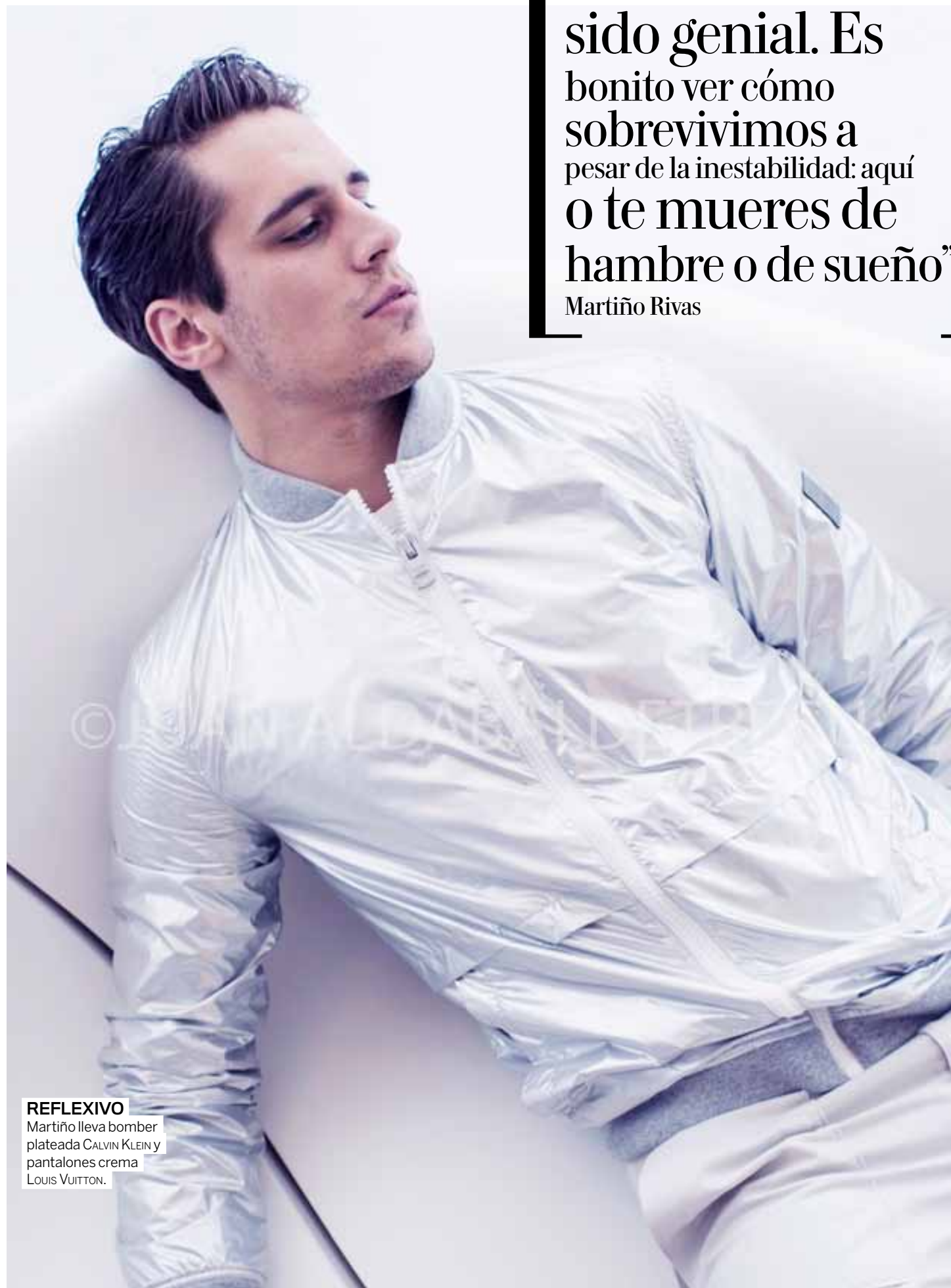
REFLEXIVO Martíño lleva bomber plateada CALVIN KLEIN y pantalones crema LOUIS VUITTON.